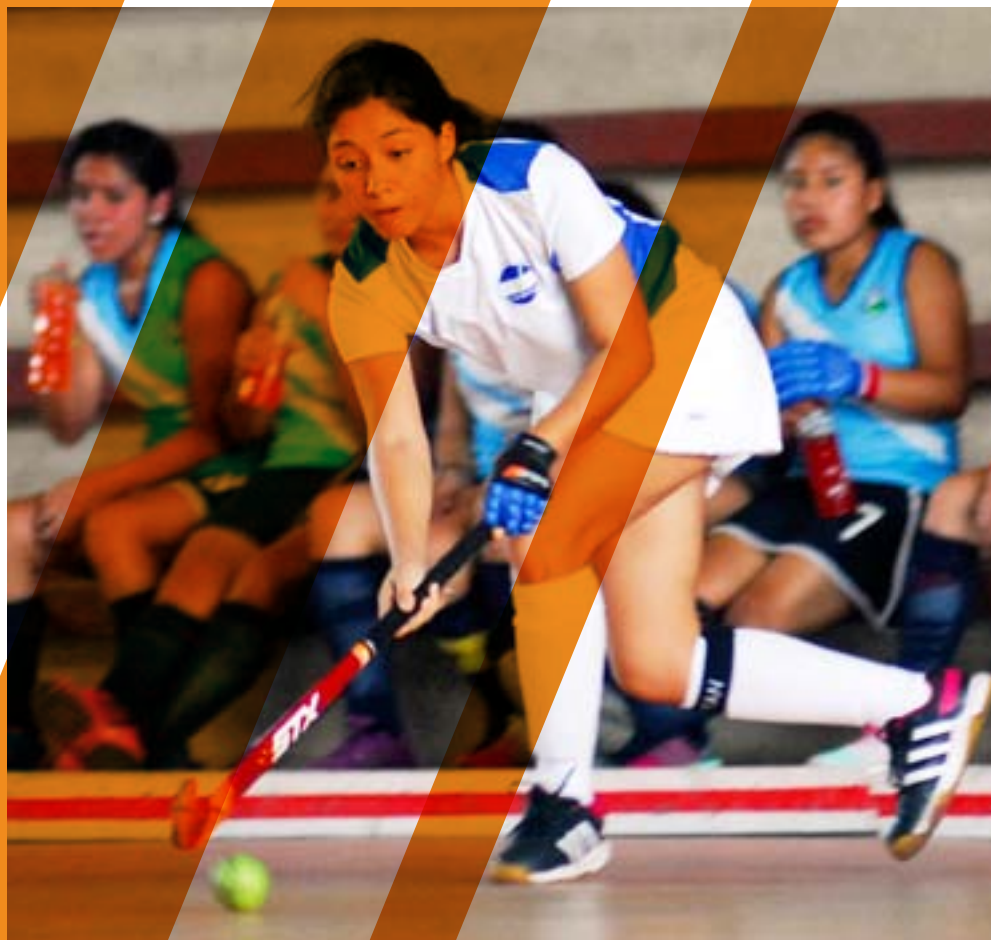
+ II Central America Indoor Tournament, M & T, Tegucigalpa, Honduras.