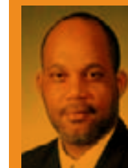
Willard Harris Competitions / Competiciones TTO