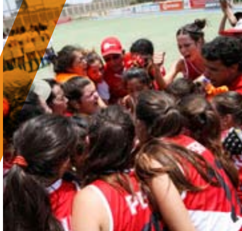
+ Pan American Challenge, M & W, Chiclayo, Perú.